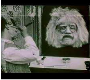
AH ! LA BARBE Durada: 1' 44" Direcció, fotografia i trucatges: Segundo de Chomón Any de producció: 1905. Producció: Pathé (França). Còpia: B/N