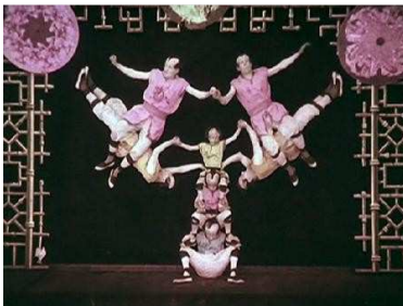
KI RI KI, ACROBATES JAPONAIS Direcció: Segundo de Chomón. Fotografia i trucatges: Segundo de Chomón Any de producció: 1907. Producció: Pathé (França) Còpia: color, Durada: 1' 52"