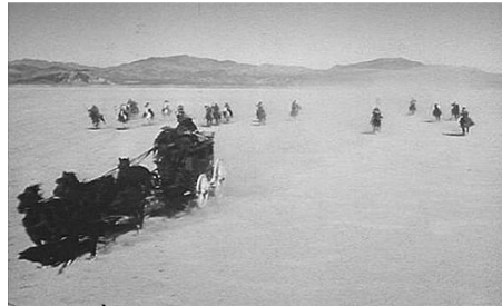
LA DILIGÈNCIA (The Stagecoach) Director: John Ford. Any de producció: 1939 Producció: FUnited Artist (EEUU) Còpia: Blanc i negre Durada: 1'30"